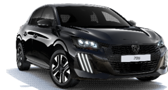
Negro Perla Nera