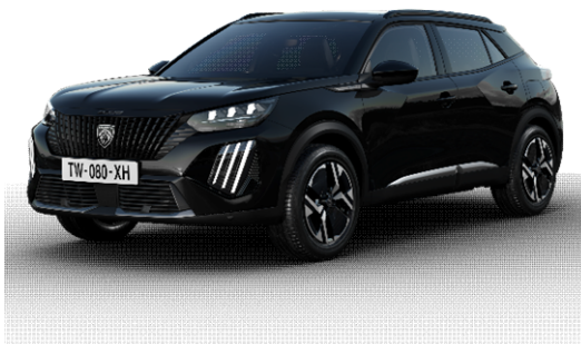
Perla Nera black